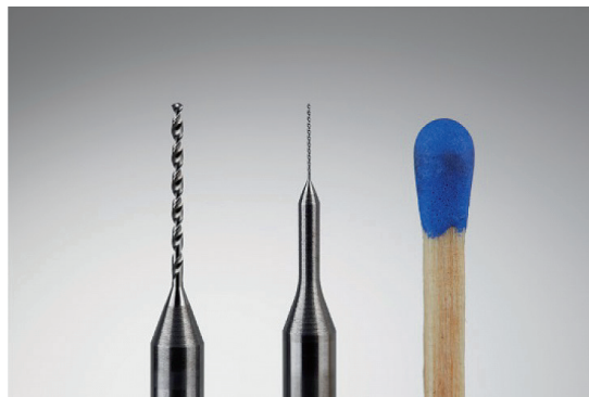
Mikrozerspanung: defektarme und glatte SISTRAL®-ultrafine